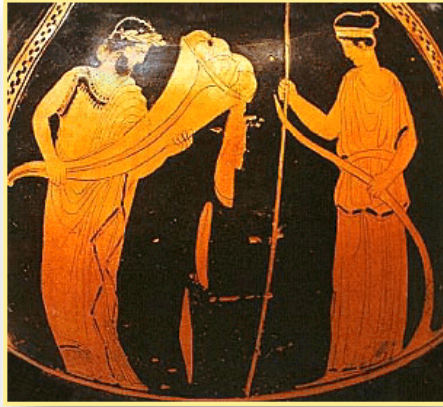
K14.5 Hades with cornucopia & Persephone

En esa época del año en que los días se van acortando y el Sol sigue fuerte, en que sigilosamente avanza el adormecimiento de la Tierra, según la leyenda se acerca el próximo traslado de Perséfone al submundo donde reina. En relación con eso, me parece interesante recordar dos aspectos importantes y bastantes originales que nos proporciona el Perdón Radical.